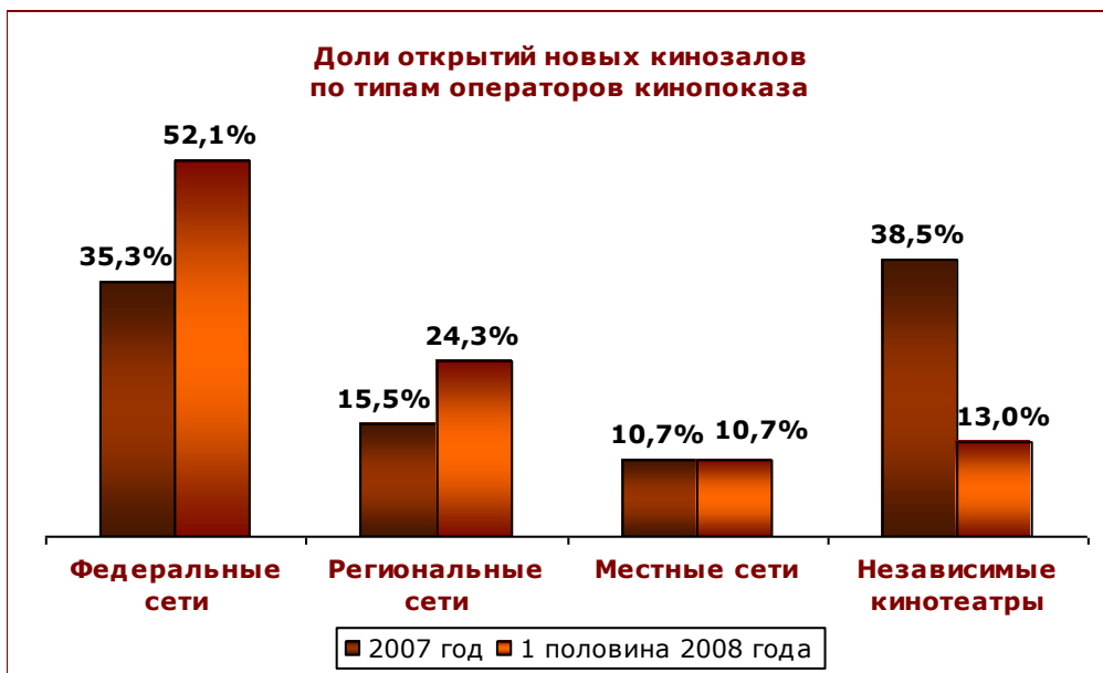
Рисунок 6. Доли открытий новых кинозалов по типам операторов кинопоказа

Рост темпов появления новых кинозалов в первом полугодии 2008-го произошел преимущественно благодаря целой серии открытий в составе киносетей. Если за весь прошлый год федеральные операторы кинотеатров открыли 15 кинотеатров (89 залов), то с января по июнь 2008-го в их составе появилось уже 88 новых залов (11 кинотеатров). Всего в 2007 г. сетевые операторы (федеральные, региональные и местные) увеличили рынок кинопоказа на 155 кинозалов (61,5% новых экранов), а с начала 2008 года – уже на 147 залов (87% всех открытий полугодия).