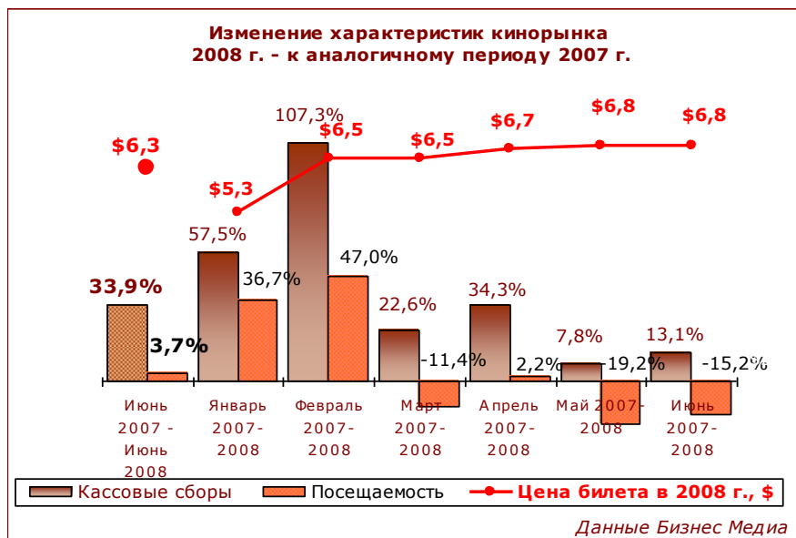
Рисунок 5. Изменение характеристик кинорынка 2008 г. – к аналогичному периоду 2007 г.

При этом наибольшая разница в результатах проката наблюдалась в январе и феврале: в 2008 г. эти месяцы оказались более прибыльными, чем в 2007-м, за счет выпуска крупных отечественных блокбастеров («Ирония судьбы. Продолжение» и «Самый лучший фильм»). В то же время посещаемость кинотеатров в марте, мае и июне оказалась ниже прошлогоднего уровня несмотря на наличие крупных блокбастеров (таких как «Кунг-Фу Панда», «Хроники Нарнии», «Индиана Джонс», «Особо опасен» и др.), которые не смогли побить рекорды 2007-го («Пираты Карибского моря» и «Шрек Третий»).