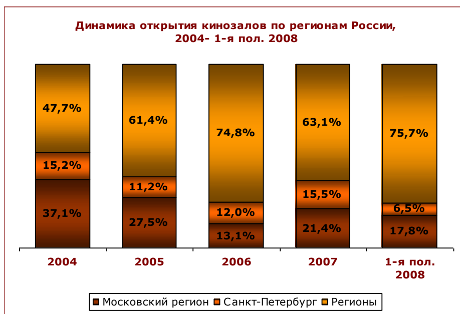
Рисунок 4. Динамика открытия кинозалов по регионам России

С начала 2008 г. большая часть вновь открываемых кинозалов (76%) появилась на региональных рынках. При этом новые площадки продолжают открываться и в Московском регионе (18%), тогда как Санкт-Петербург вносит наименьший вклад в число новых залов в 2008 г. (лишь 6%).