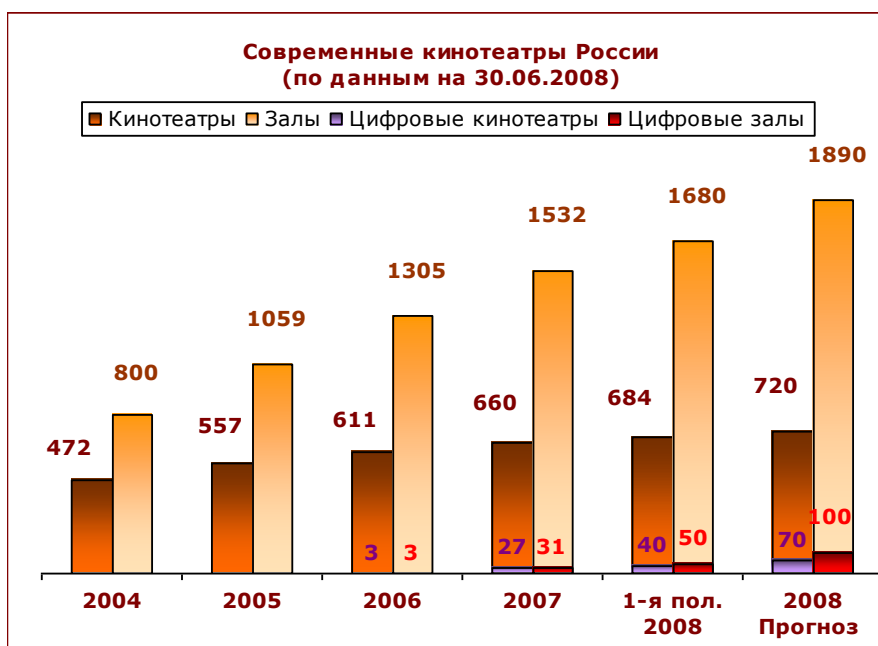
Рисунок 1. Современные кинотеатры России (на 30.06.08)

К концу 2008 г. общее число современных кинозалов в стране может приблизиться к 1900 (более 700 кинотеатров) – годовой темп роста, таким образом, составит около 24%. Это увеличение темпов роста (по итогам 2007 г. рынок вырос лишь на 17,4%) обусловлено тем, что в 2008–2009 гг. завершается строительство объектов в регионах страны, начатое в 2006–2007 гг. – в период начала региональной экспансии киносетей. При этом в отдельных городах рынки кинопоказа оказываются насыщенными и даже перенасыщенными. Заметим, что операторам кинотеатров на таких рынках требуется некоторое время, чтобы адаптироваться к работе в новых условиях: только в нынешнем году устаревшие и неконкурентоспособные кинокомплексы в «насыщенных» регионах (освоенных в 2007 г.) начинают закрываться или реконструироваться (например, в Казани, Тольятти и Самаре).