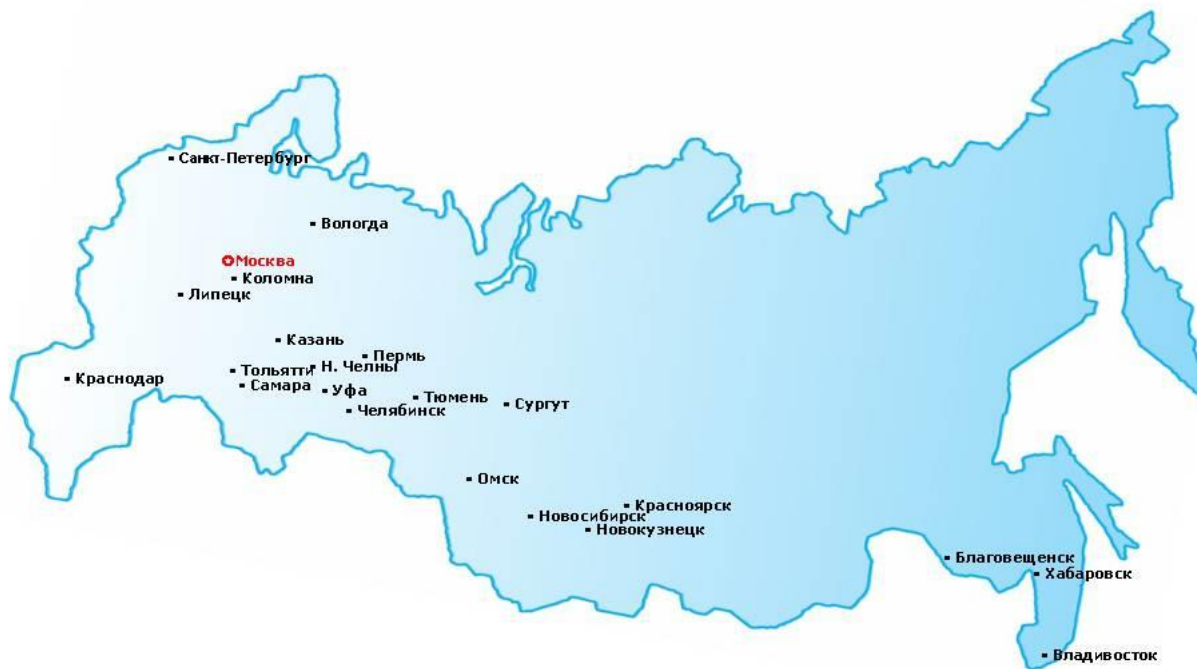
Рисунок 2. География цифровой киносети России (на 30.06.08)

«Цифровая революция» в России «вершится» пока руками единичных энтузиастов: за исключением сети «Синема Парк»,