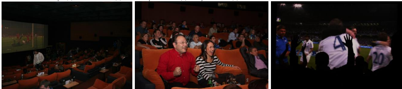
Трансляция финального футбольного матча кубка UEFA в кинотеатре «Джем Холл»

Еще одна возможность привлечения зрителя в условиях возрастающей конкуренции – оборудование залов повышенной комфортности. VIP-залы в российских кинотеатрах становятся все более изысканными; развиваются концепции целых кинотеатров премиум-класса; крупные киносети выделяют это направление в качестве стратегического и планируют оснащать все свои комплексы отдельными залами с прилегающей территорией только для VIP-клиентов – например, проект сети «Синема Парк» по оборудованию в своих новых мультиплексах залов и зон Relax.