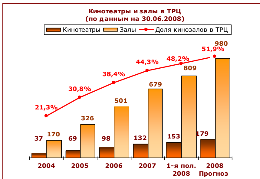
Рисунок 3. Кинотеатры и залы в ТРЦ (на 30.06.08)

подошедшей к этому вопросу стратегически, ни один из крупных федеральных сетевых операторов до сих пор не внедрил цифровое оборудование в своих кинозалах системно. Однако во втором полугодии 2008 г. в этой области ожидаются изменения: оснастить «цифрой» по два зала во всех своих кинотеатрах планирует компания «Rising Star Media»; оборудовать свои новые площадки рассчитывает и оператор «Планета развлечений»; продолжает инновационную политику «Синема Парк». Кроме того, еще не иссяк поток энтузиастов – независимых киноплощадок по стране, а также местных киносетей, готовых к освоению новых технологий. По нашим оценкам, число цифровых залов к концу года может превысить сотню, причем большинство открытий ожидается к сентябрьскому релизу главного 3D фильма года – «Путешествие к центру земли».